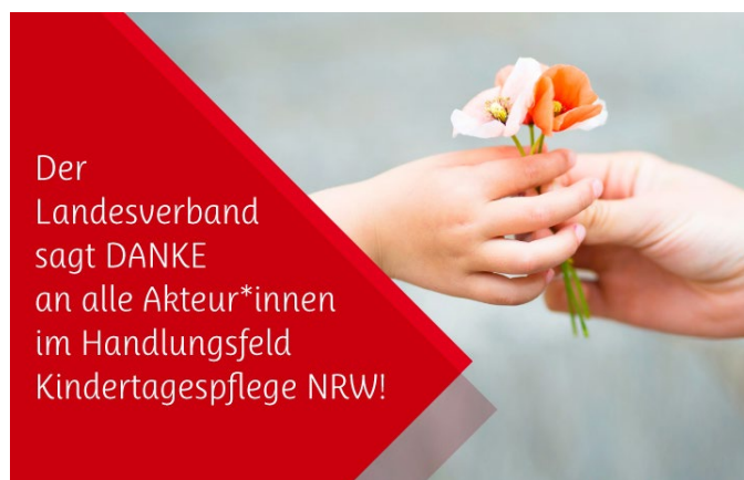
Ein Gruß als Dankeschön auf unserer Webseite